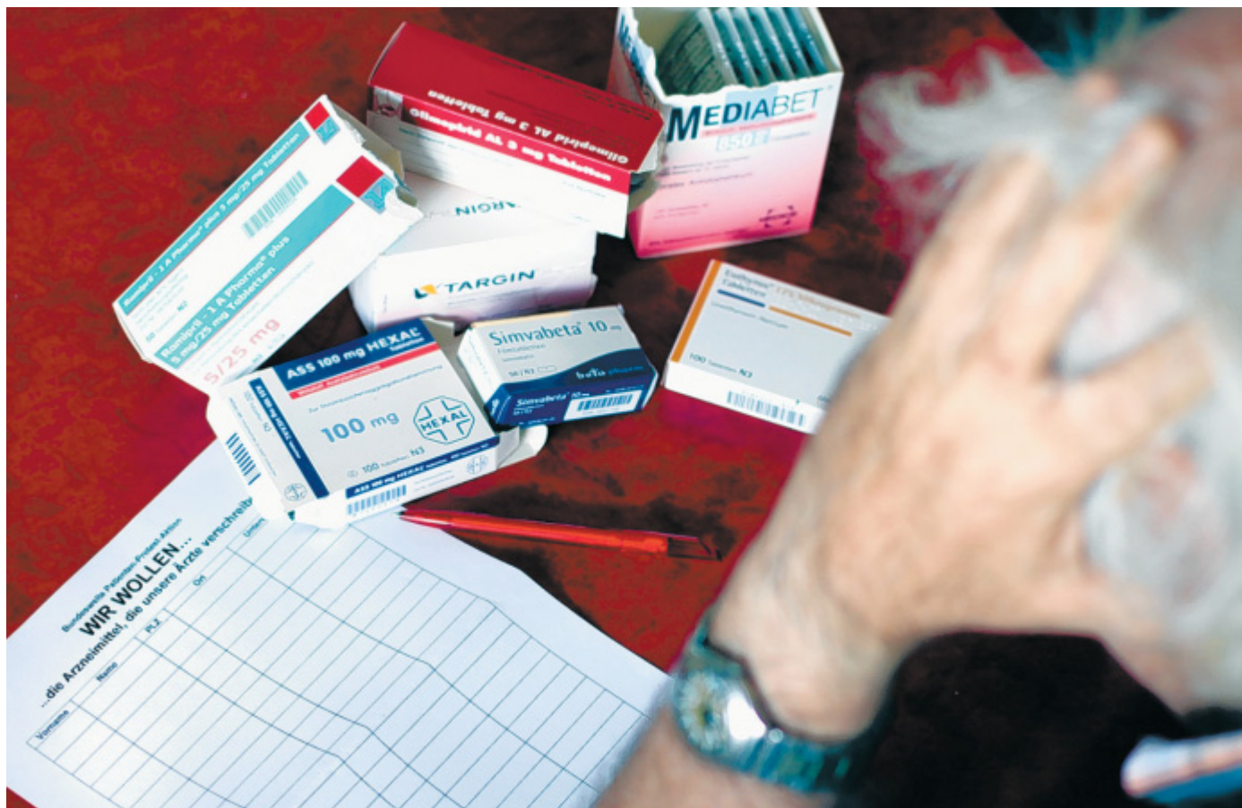
Überblick verloren: Viele Patienten müssen mittlerweile mit anderen Arzneimitteln vorlieb nehmen, als sie es seit Jahren gewöhnt sind. Besonders bei älteren Menschen entsteht durch die Rabatt-Verträge reichlich Verwirrung. Eine Unterschriften-Aktion soll helfen.

■ Bünde. Am Freitag, 8. Juli, ist ein eintägiger Nordic Walking Einführungskurs. Start ist ab Parkplatz Kahle Wart in Hüllhorst-Oberbauerschaft. Der Kurs ist für Einsteiger in die Nordic Walking Technik und zur Technik Nachschulung geeignet. Bekanntermaßen stellen sich die positiven Auswirkungen dieses Sportes auf den Schulter-Nacken-Bereich nur beim korrektem flachen Stockeinsatz ein. Der Kurs findet von 17 bis 20 Uhr statt. Er beinhaltet Theorie und Praxis. Kursleitung hat Heike von der Forst. Stöcke können ausgeliehen werden. Anmeldung unter Tel. (05742) 70 27 56 Infos unter: www.nwwe.de .